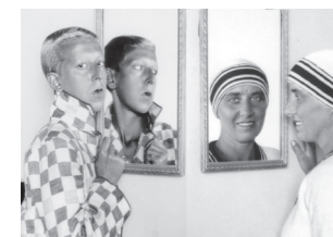
Claude Cahun et Marcel Moore

Documentaire de Barbara Hammer ; États-Unis ; 2006 ; 55 min Programme détaillé du « Printemps lesbien 2024 » : bagdam.org